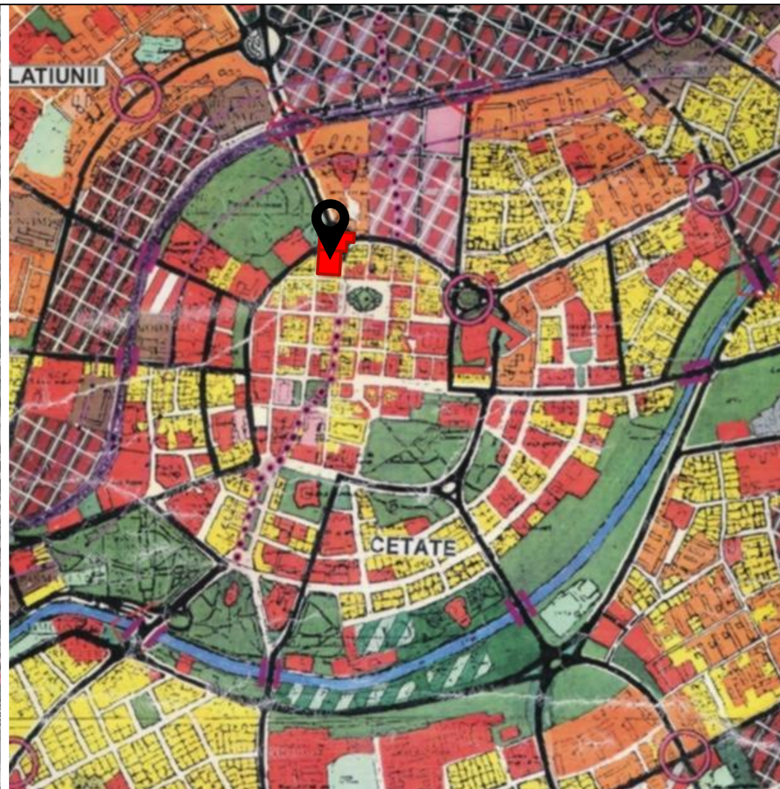
Localizare amplasament - extras PUG aprobat prin HCL 157/2002, prelungit prin HCL 619/2018