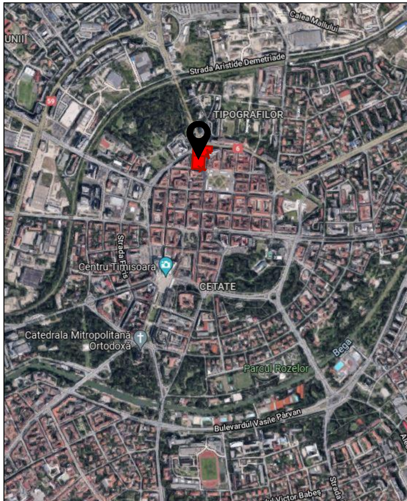
Localizare amplasament - extras Google maps