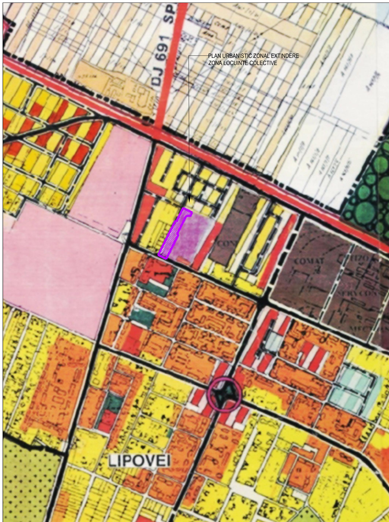
PLAN URBANISTIC ZONAL EXTINDERE ZONA LOCUINTE COLECTIVE