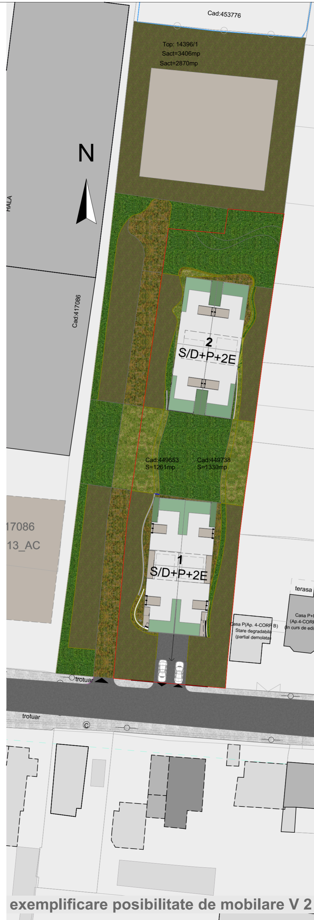
exemplificare posibilitate de mobilare V 2

P.U.Z. - LOCUINTE COLECTIVE CU REGIM MIC DE INALTIME (S/D+P+2E) CU SPATII COMERCIALE/SERVICII COMPATIBILE CU LOCUIREA, LA PARTER Municipiul Timisoara, judetul Timis, str. Gavril Muzicescu, C.F. nr. 449653, nr. cad. 449653; C.F. nr. 449738, nr. cad. 449738