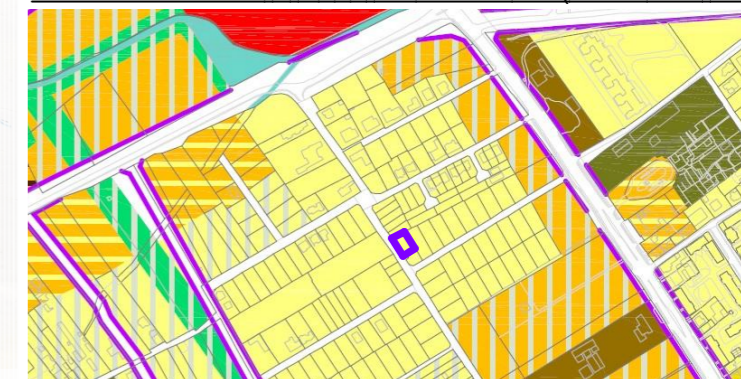
ÎNCADRARE ÎN P.U.G. NOU